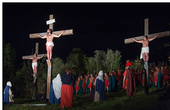
Figure esili, possenti soldati e centurioni, luccichii di donne romane, il quadro dei ladroni, i maestosi cavalli fanno da cornice ad un Cristo che ondeggia e soffre nei 90 minuti di percorrenza della Via Crucis. L'arrivo in prossimità del Calvario è il preludio della fusione dei due eventi fino allora separati (corteo e scene), che il coordinamento di una collaudata regia riesce tutti gli anni ad integrare con abilità e suggestione.

Le 500 figure in costume che compongono il corteo storico della Rievocazione Storica del Venerdì Santo di Grassina, danno vita ad uno dei momenti più rappresentativi della serata.